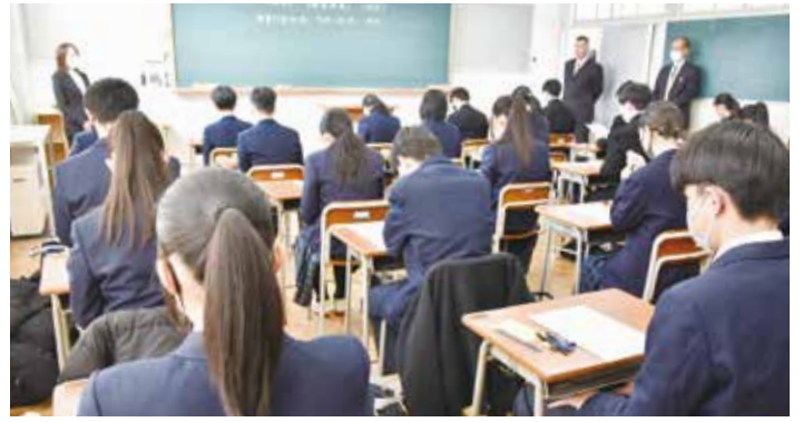
公立・前期選抜で学力検査1の開始を待つ受験生(2月10日、更級農業高で)

昨年12月に県教育委員会が決めた、26年度公立高校入学者選抜の実施日程は1面左上の表1の通り。前期選抜は志願受付が26年2月2~4日で、2月9日に選抜試験、合格発表が同18日。後期選抜は志願受付が2月25~27日、3月10日に選抜試験を行い合格発表は同19日。追検査は3月16日。