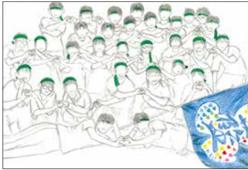
(Lovely Darkness Emperorさん 北佐久郡・中3)