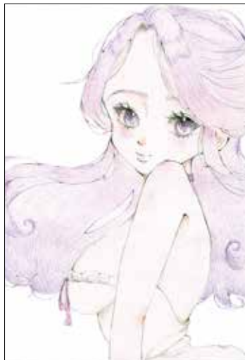
(ちーさん 長野市・中3)