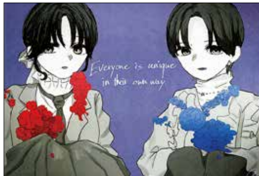
(もっくさん 長野市・中2)