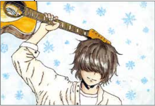
(はなさん 南佐久郡・中3)