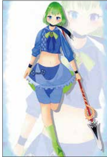
(フランさん 長野市・中2)