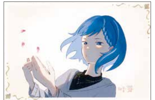
(叶芽さん 上伊那郡・中3)