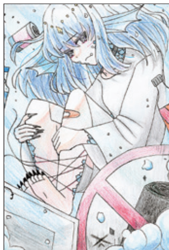
(本しめじさん 塩尻市・中2)