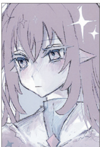
(ドラミングさん 岡谷市・中3)