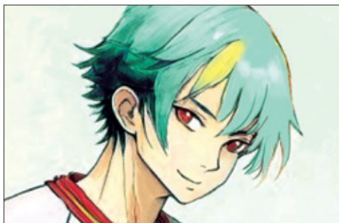
(サッカー少女さん 上田市・中3)