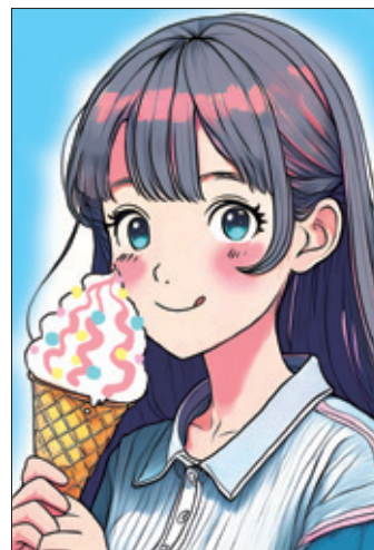
(●▲■さん 安曇野市・中3)