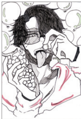
(亜論さん 諏訪市・中3)