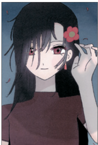
(シルバーバックさん 岡谷市・中3)