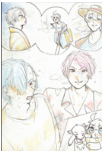
(尋城さん 松本市・中3)