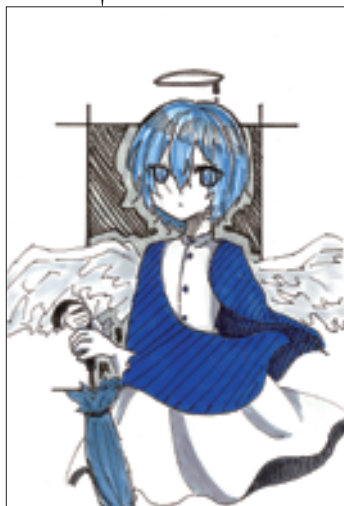
(天泣の天使さん 長野市・中3)