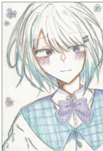
(幽さん 大町市・中3)