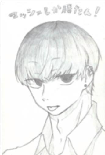
(マッシュは世界を救うさん 阿智村・中3)