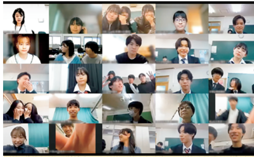
活発な討議を行った参加生徒ら