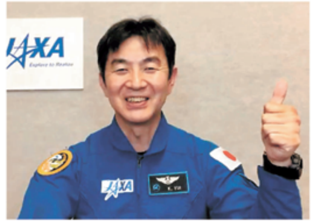
米テキサス州ヒューストンから日本時間16日にオンラインで記者会見し、ポーズをとるJAXAの油井亀美也飛行士