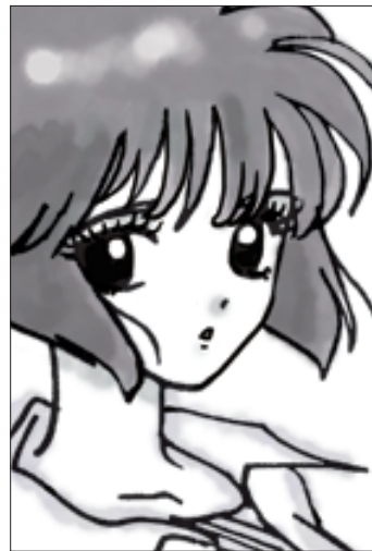
(A to Zさん 大田市・中3)