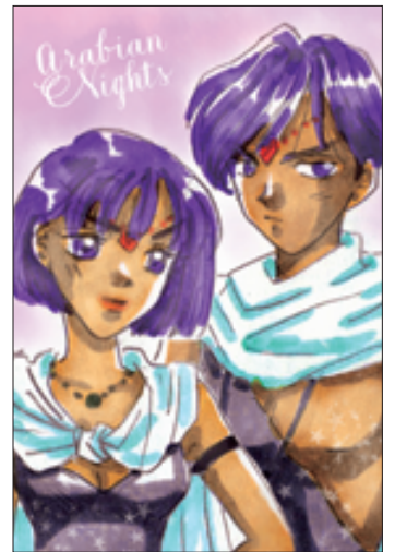
(勇者さん 佐久市・中3)