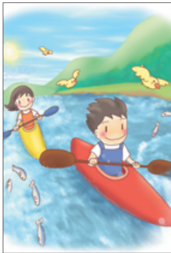
(納豆大好きさん 飯田市・中3)