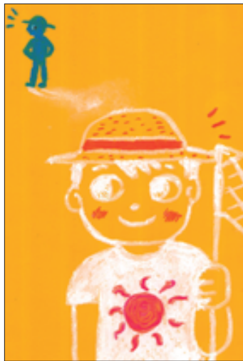
(わんぱくさん 北安曇郡・中2)