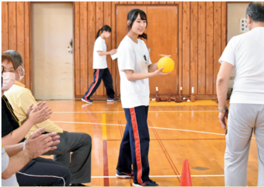
お年寄りと一緒にボウリングを楽しむ生徒たち