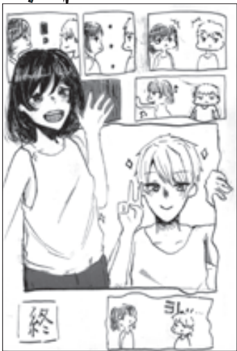
(漫画とイラストを組み合わせた。さん 上田市・中3)