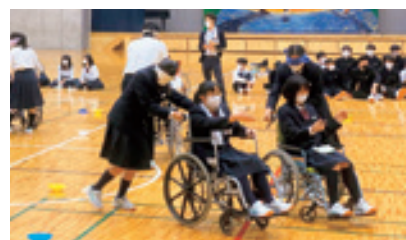
訪問講座での車いす体験

介護の仕事についてもっと知りたい場合は、社会福祉協議会が実施する訪問講座や福祉の職場体験に参加して、現場で働く人たちから学ぶことができる。