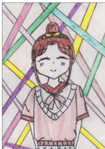
(アカハネさん 塩尻市・中2)