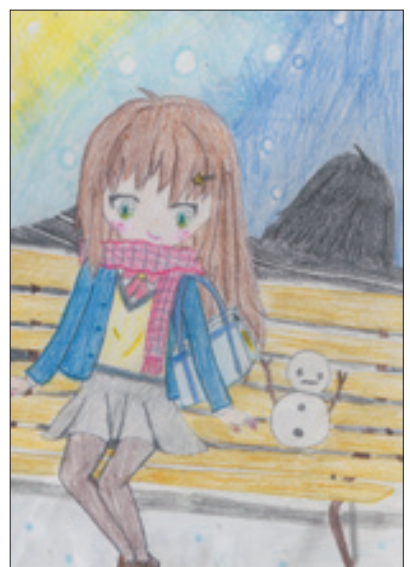
(冬が大好きさん 佐久市・中1)