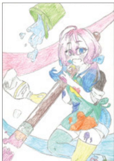
(にゃんたろーさん 下伊那郡・中2)