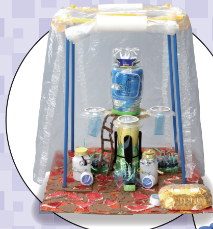
小学1・2年生の部 「浄水器「マーズ」」