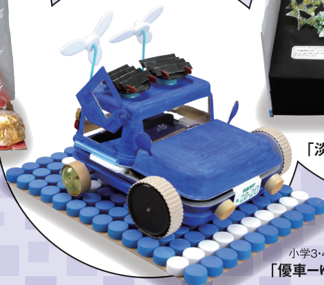
小学3・4年生の部 「優車-ゆうしゃー」