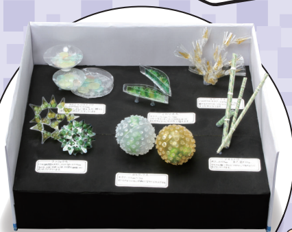
小学5・6年生の部 「淡水植物プランクトン標本」