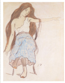
パウル・クレー 椅子に座る少女 1898-99年頃 19-20才頃【前期展示】