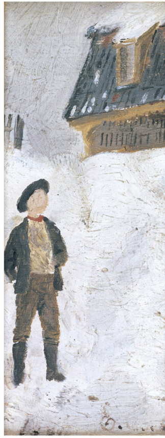
エドヴァルド・ムンク 雪景色の中の少年 1881年 18才

モネ、ムンク、ロートレック、ピカソ。 岸田劉生、平山郁夫、横尾忠則。 教科書に載っているようなアーティストにも、 あなたと同じ10代の頃がありました。 絵を描くことに夢中な人もいれば、 案外別のことが得意だった人も。 のちに代表作と言われる画風とは 180度違う作品もあります。 キラキラしたり、ガツガツしたり、シュンしたり。 どんなに時代が変わっても、それが誰であっても、 「10代」が特別なことはみんな同じ。 世界と日本の巨匠たちの子ども時代の絵を通して、 あなたの心の「キラキラ」をたくさん見つけてください。