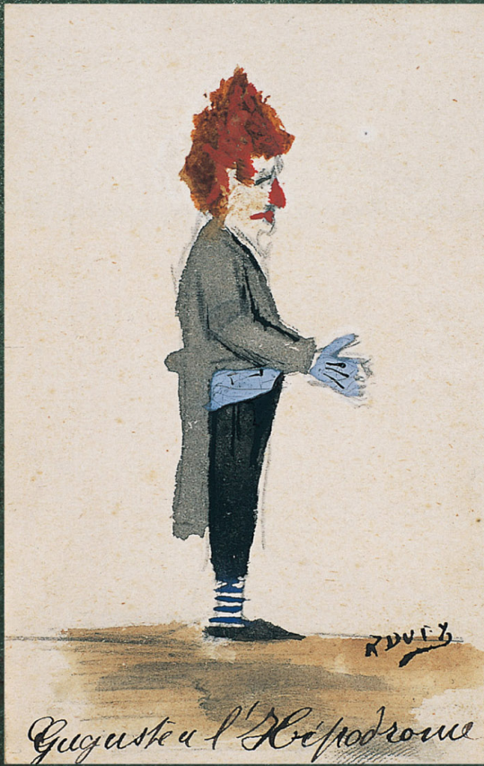
なまえ ラウル・デュフィ 題 競馬場のギュギュスト 1890年 13才