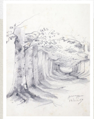
クロード・モネ 森の散歩道 1857年 17才 【前期展示】