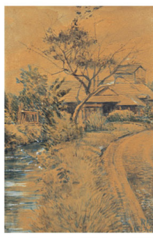
岸田劉生 秋 1907年 16才【前期展示】

前期展示 2月11日(金・祝)～28日(月) ● 後期展示 3月2日(水)～21日(月・祝)