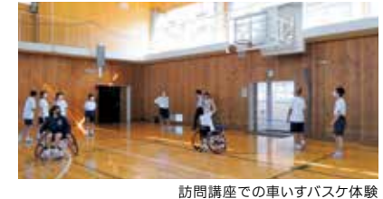
訪問講座での車いすバスケット

介護や介護の仕事についてもっと知りたい場合は、社会福祉協議会が実施する訪問講座や福祉の職場体験に参加すれば現場で働く人たちから学ぶことができる。